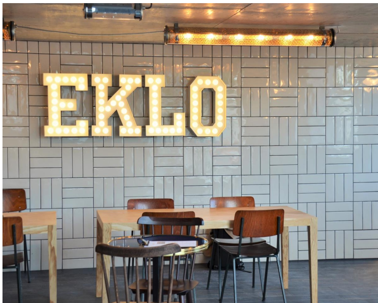
Eklo Bordeaux

Lors de son inauguration qui a eu lieu le 25 juin dernier et a réuni plus de 200 personnes, Eklo Bordeaux s'est vu remettre son étiquette environnementale par Betterfly Tourism. Les mesures éco-responsables mises en place par le groupe lui permettent ainsi d'obtenir un « A » et font d'Eklo Bordeaux le 5 e hôtel le plus écologique de France.