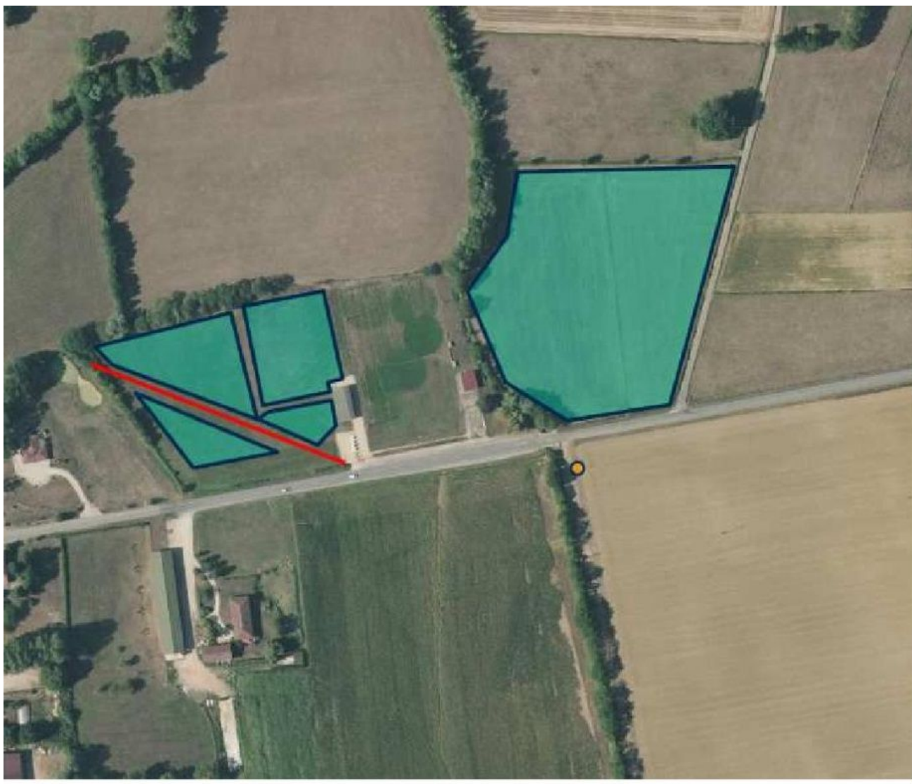
PLAN GENERAL DU SITE