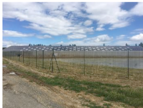
Bassins utilisés par des canards