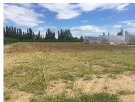
800 agrumes plein champ