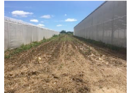
Espace inter-serres planté