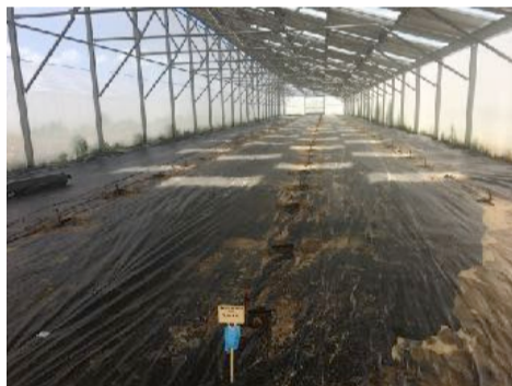
Serres avec jeunes plants