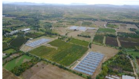
3 sites - 3 exploitants

Installation de deux exploitants en arboriculture (plantations prévues en juin et en octobre 2018) et d'un petit exploitant en poule pondeuses bio. Un des sites accueillera un parcours pédagogique pour les enfants (ils planteront chacun un arbre sous une des serres avec leur nom).