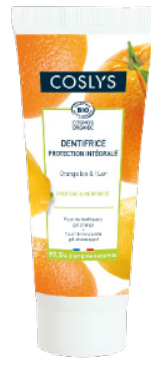
DENTIFRICE PROTECTION INTÉGRALE