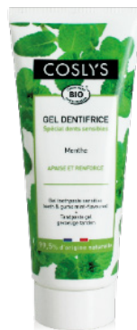
DENTIFRICE DENTS SENSIBLES