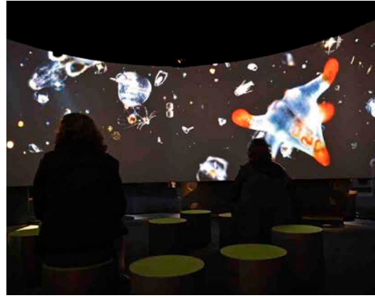
Exposition « Océan, une plongée insolite »

À l'Aquarium tropical de la Porte Dorée qui sera exceptionnellement gratuit tout le week-end, outre les événements ouverts à tous (animations, concerts, ateliers, ciné-concert), une journée sur les sciences participatives marines, réservée aux professionnels, donne des pistes pour participer à des programmes de recherche ou d'observation sur les milieux marins et littoraux tandis que le congrès des jeunes aquariologistes rassemble de son côté 20 classes d'Île-de-France qui ont travaillé toute l'année sur un thème lié à l'Aquarium tropical. Cette troisième édition, parrainée par Thomas Lesage et Valérie Masson-Delmotte, est l'occasion d'apprendre en famille à protéger l'océan et ses littoraux.