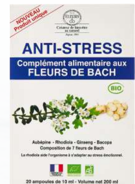
Complément alimentaire anti-stress