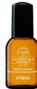
Parfum d'ambiance ANTI-STRESS

Disponible en 20 ml - 19,95 € ou en 30 ml - 27,50 € Spray buccal 10 ml - 12,50 €