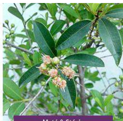
Maté & Stévia

La gamme Silhouette se dévoile avec ses 5 soins certifiés biologiques pour vous offrir une parenthèse de légèreté et d'équilibre, pour retrouver confiance en soi, harmonie et se réconcilier avec son corps. Les formules de ces produits sont d'origine biologique et ont été pensées avec des actifs de haute qualité qui agissent en synergie :