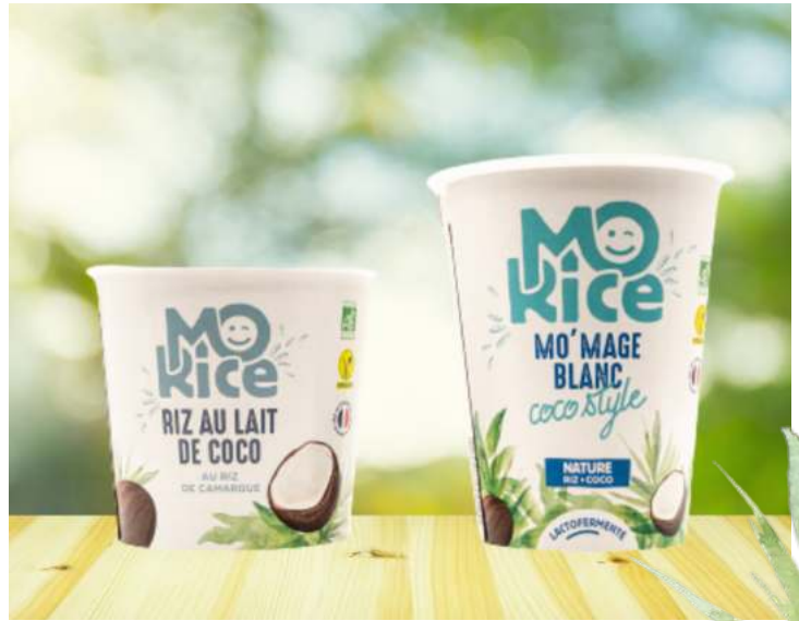
Photo du Riz au lait de coco et du Mo'mage blanc.

Ces deux produits sont en accord avec la mission de l'entreprise : valoriser les ressources locales (Riz de Camargue) à travers de délicieux desserts.