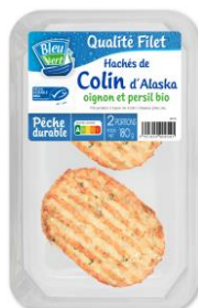
Haché de colin d'Alaska MSC aux ingrédients bio - 180g – PMC : 4,80€