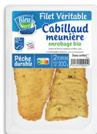
Filet de cabillaud MSC meunière bio - 200g PMC : 5,90€