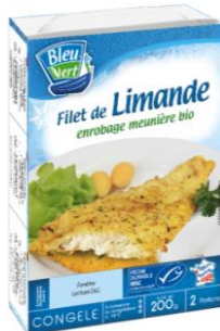
Filet de Limande MSC meunière bio - 200g – PMC : 5,50€