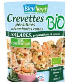
Crevettes persillées bio - 100g PMC : 5,50€