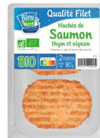
Haché de saumon bio - 180g PMC : 6,90€