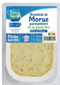
Brandade de morue MSC accompagnée d'une purée bio - 290g PMC : 6,70€