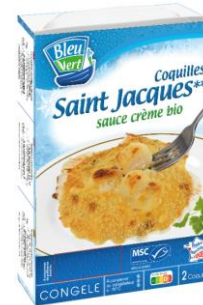
Coquilles Saint-Jacques MSC sauce crème bio - 200g – PMC : 8,90€