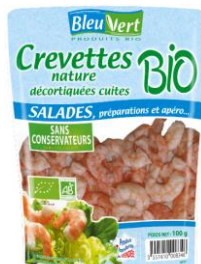
Crevettes nature bio - 100g PMC : 5,50€