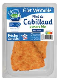
Filet de cabillaud MSC panure bio - 200g PMC : 5,25€