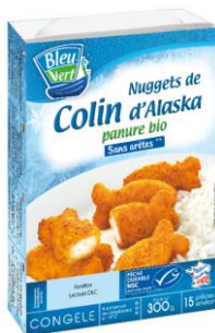
Nuggets de colin d'Alaska MSC panure bio - 300g – PMC : 5,90€